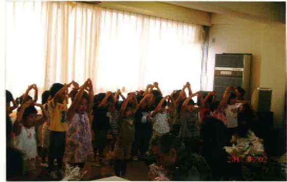
高齢者と保育園児の交流